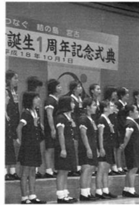
△みやこ少年少女合唱団による市歌合唱